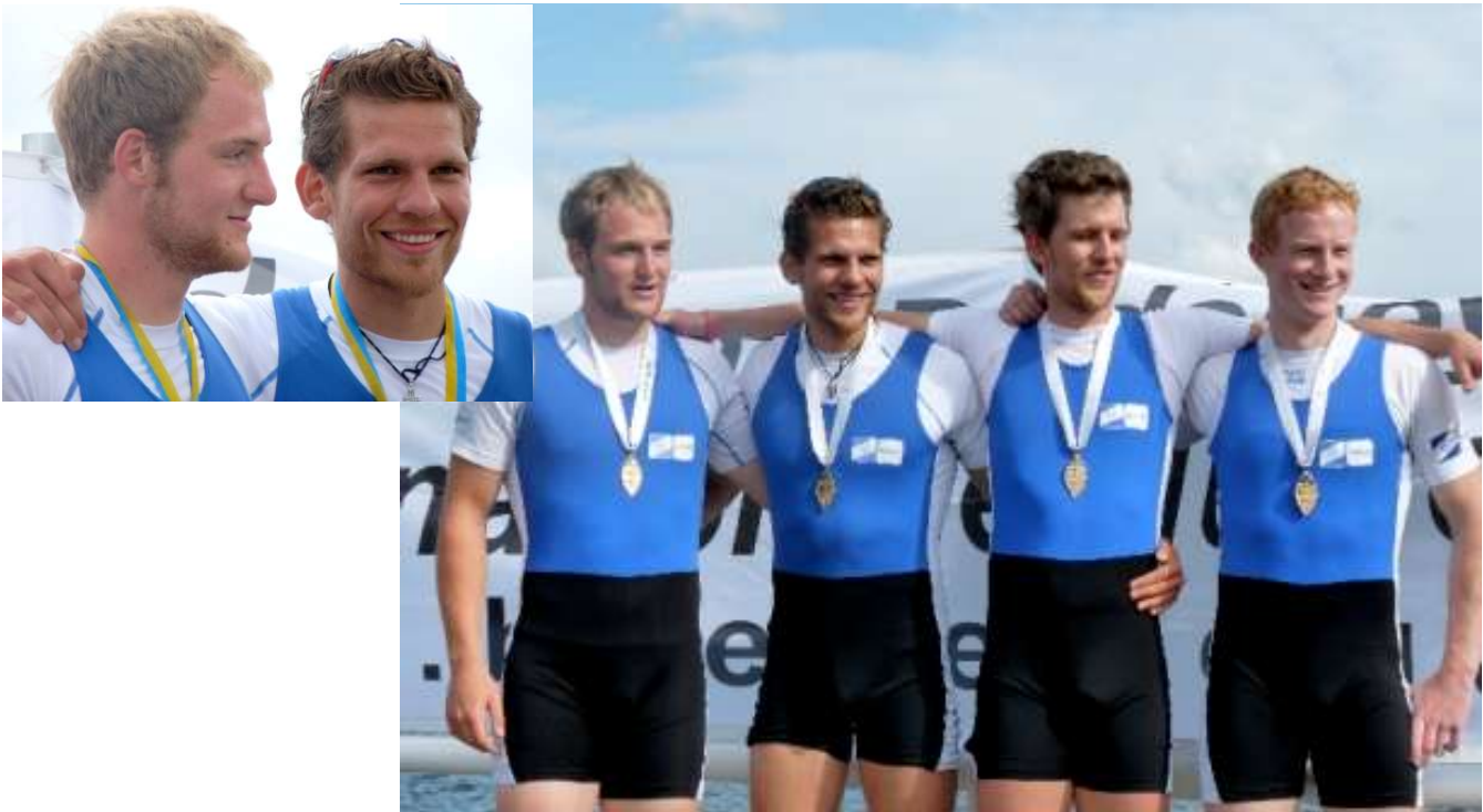
Machten ihr Meisterstück: Der Vereinsvierer des RTHC

muss bei den erfahrenen Ruderinnen ihre Stärken unter Beweis stellen, im führenden Boot und verwies mit ihrer Mannschaft die Holländer, Briten und auch das zweite deutsche Boot auf die hinteren Plätze.